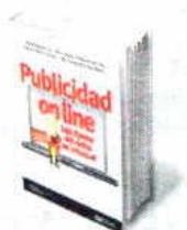
Autores: Varios Editorial: ESIC Precio: 19.95 euros